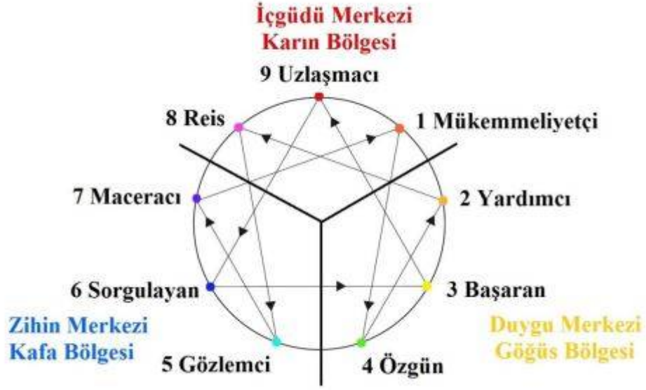
Şekil 2.2: Enneagram Sembolü